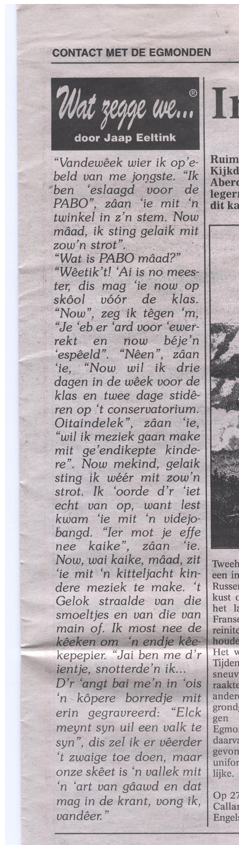
Uit "CONTACT MET DE EGMONDEN" van 30 juni 1999